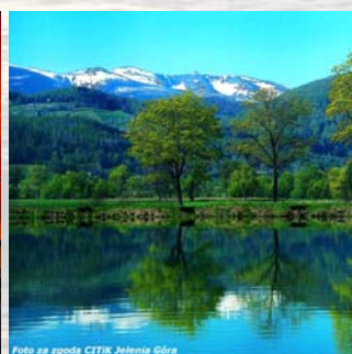
Het meren gebied in Lubuskie. Het Reuzengebergte (1600 m NAP).