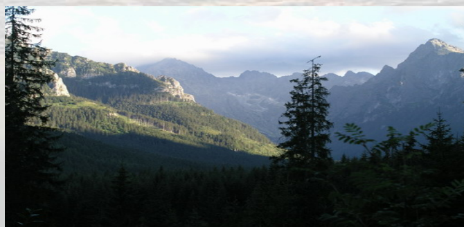
Het Tatra gebergte (2500 m NAP) in het zuiden van Polen..